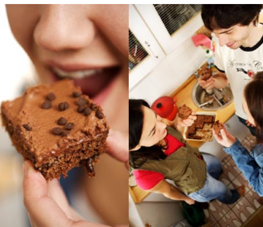
STYLING: JIDLA; MILENA VOLFOVÁ; DEKOR: STYLING: XXXX; PRODUKCE: VERONIKA BRODSKÁ

Vinný kámen vzniká vysrážením během kvašení a zrání vína a má vynikající kypřící účinky. Na rozdíl od prášku do pečiva neobsahuje fosfáty. ■